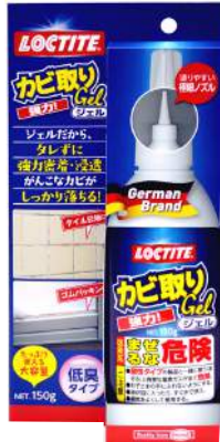
主成分：次亜塩素酸塩

内箱TFコード 24976742256497 外箱TFコード 14976742256490